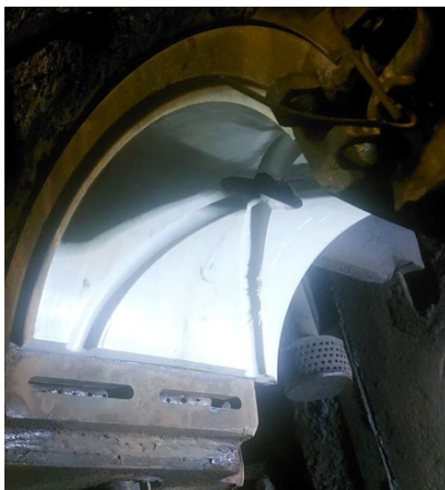
Рис. 2. Зовнішній вигляд розташування вкладишів з тимлон-7: а) № 2 з приводної сторони; б) № 3 з холостої сторони