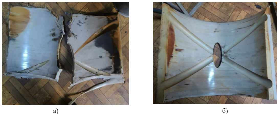
Рис. 4. Загальний вигляд фотофіксації робочій поверхні вкладишів з тимлону-7: а) приводна сторона – № 2, б) холоста сторона – № 3

вкладиш №3 з тимлону-7 придатний для подальшої експлуатації та може використовуватись у нижніх подушках пільгерстану.